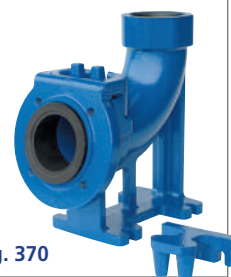
VEDI SCHEMA SEE SCHEME pag. 370