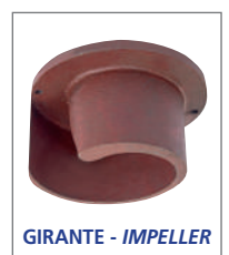
GIRANTE - IMPELLER